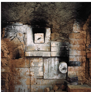
Susanna Pozzoli, Handmade_KW#9 , 60x60 cm, 2010