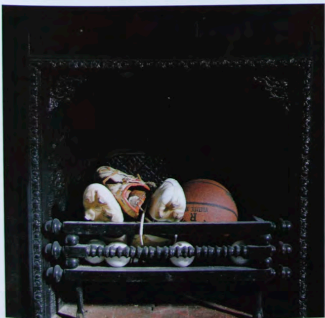
On the Block#17