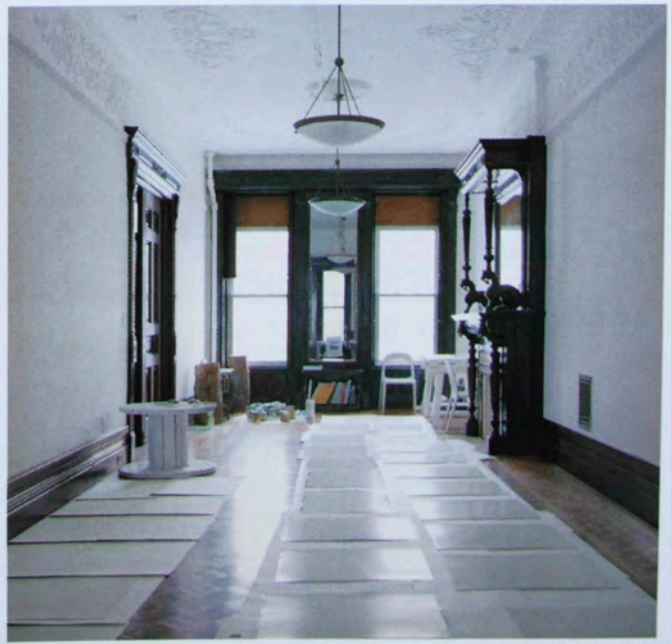
On the Block#35