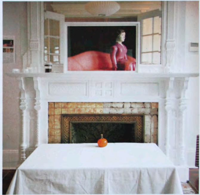
On the Block#59