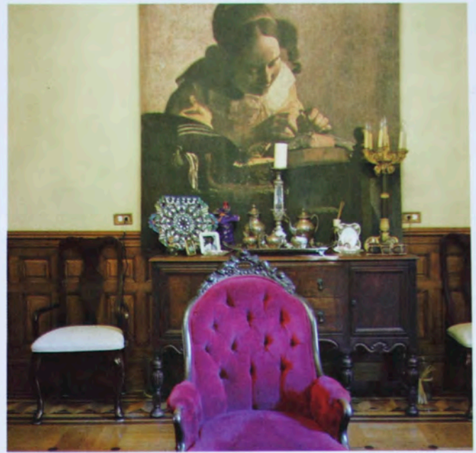
On the Block#22