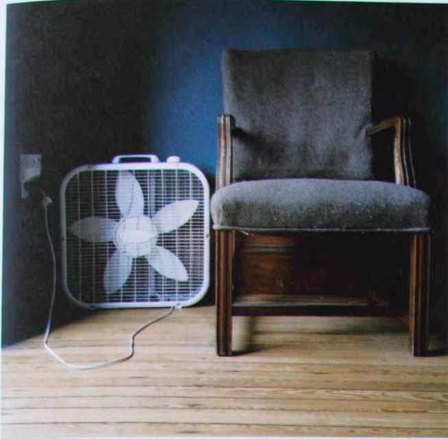
On the Block#1