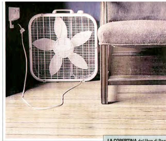
LA COPERTINA del libro di Pozzoli