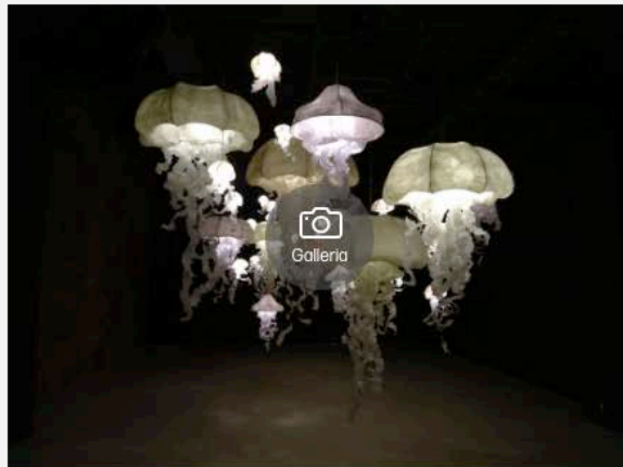
Le mostre: Best of Europe, Open Care, Talento naturale e Fondation Bettencourt Schueller

5. States of design 11: Design fatto a mano