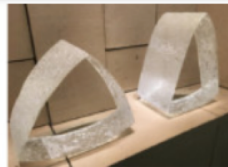
Sous l'œil d'Alain Lardet