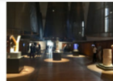
Michele De Lucchi scénographe